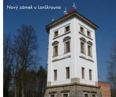
Nový zámek u Lanškrouna