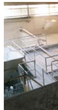
Vysoce kv je zákla