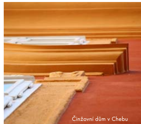
Činžovní dům v Chebu